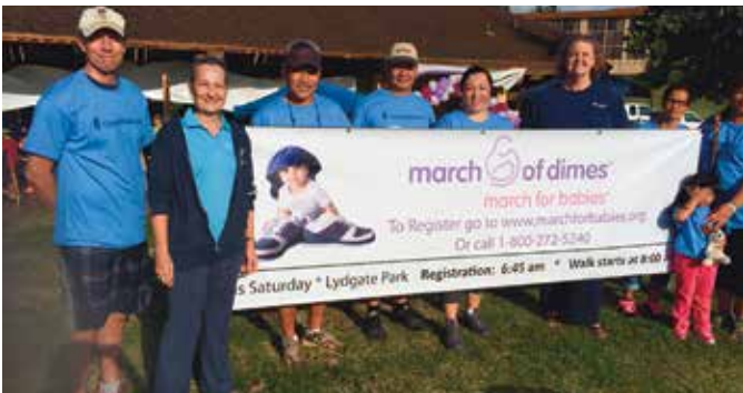
마치 오브 다임즈(March of Dimes, 소아마비 구제 모금 운동), 마치 포 베이비스 워크(March for Babies Walk), 카파아