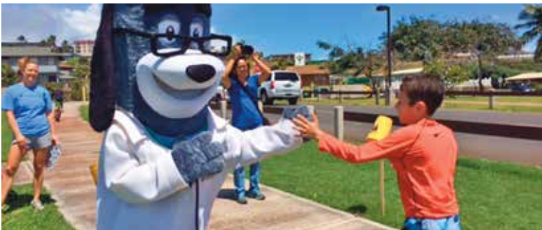
마우이 가족 YMCA 건강한 아동의 날 5K 및 장거리 달리기 대회(Maui Family YMCA Healthy Kids Day 5K and Fun Run), 카홀루이