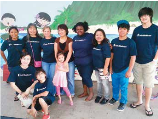
다음 단계 피난처 2월 케이크 생일 파티(Next Step Shelter February Keiki Birthday Party), 호놀룰루

우리는 또한 살고 일하는 지역사회에 자발적으로 기여합니다. 우리는 만나는 각 사람과의 유대감을 소중히 여깁니다. 최근에 우리가 지역사회 일원으로 단결했었던 몇 가지 행사를 생각해 보십시오.