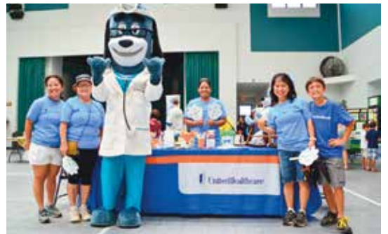
가족 잔치 / 소중한 아동 가족 행사 (Celebrate Your Family / Cherish the Child Family Event), 힐로