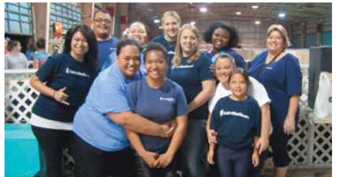
다음 단계 피난처 2월 케이크 생일 파티(Next Step Shelter February Keiki Birthday Party), 호놀룰루