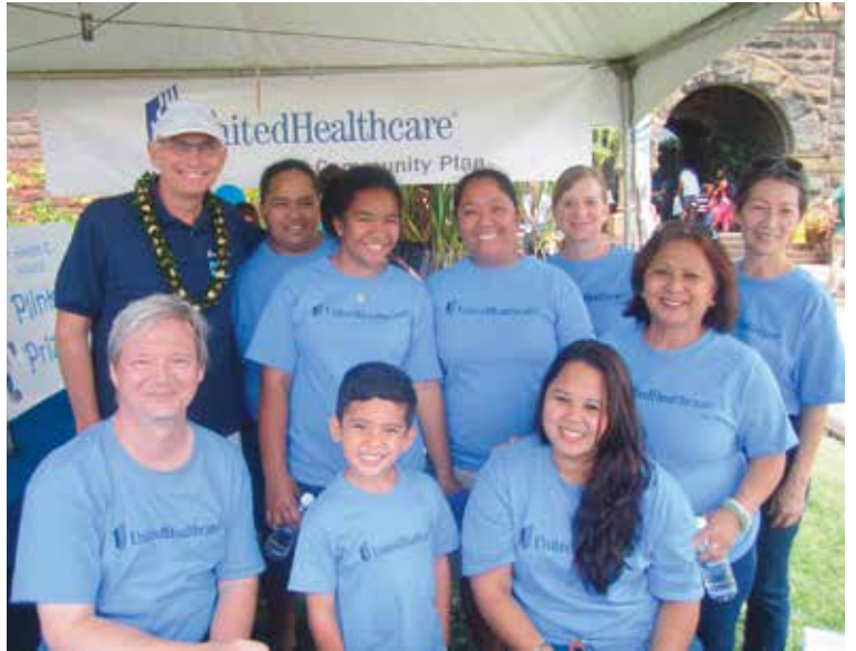
제 6회 연례 YMCA 건강한 아동의 날, 호놀룰루