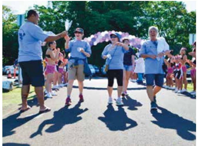
마치 오브 다임즈(March of Dimes, 소아마비 구제 모금 운동), 마치 포 베이비스 워크(March for Babies Walk), 힐로