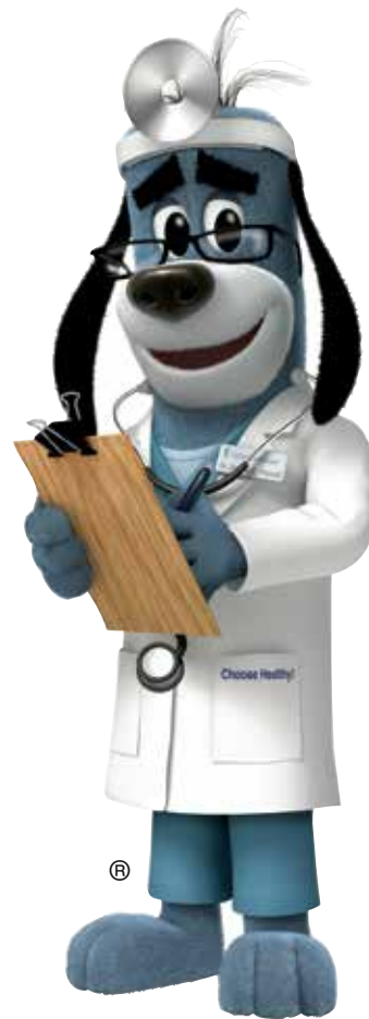
Ni Dr. Health E. Hound® ket maysa a nakarehistro a trademark ti UnitedHealth Group.

Kamakamen. No panawenen para iti checkupmo wenno ti anakmo, agtawagka tapno mangaramidka ti appointment itatta. Saankan nga aguray agingga iti summer, inton busy-n dagiti opisina dagiti pediatrician wenno doktor dagiti ubbing. Itugotmo iti appointmentmo dagiti aniaman a pormas ti eskwelaan, isports wenno camp a kasapulam nga fill-upan.